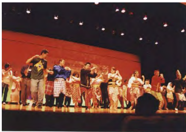
会場が一体となったポチョポチョダンス

5月26日 大和町さわらびホール たくさんの留学生が参加して、国際色豊かな集まり になりました。