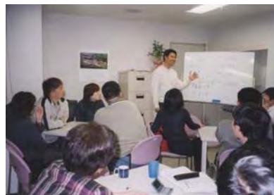
好評の留学生による母国紹介シリーズ