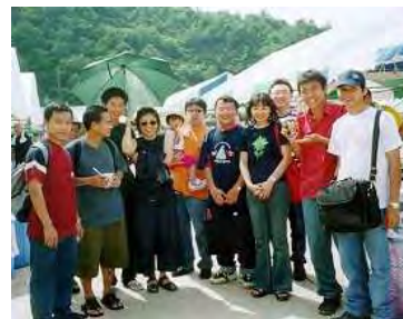
「夏の雪祭り」を満喫しました。

翌日の28日は湯之谷村銀山平の「夏の雪祭り」に 参加しました。初めてさわる(しかも夏の)雪に留 学生は喜んでいました。