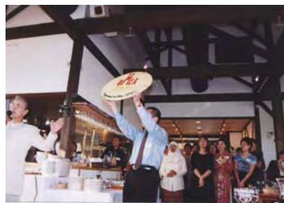
葡萄の花での懇親パーティー umex サロンの看板が披露されました