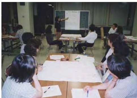
ワークショップで「umex でやりたいこと」 と「その実現方法」を話し合いました

ワークショップにより「将来の夢」を話し合いました。 まとめられた意見は、今後の部会の活動に生かしていきます。