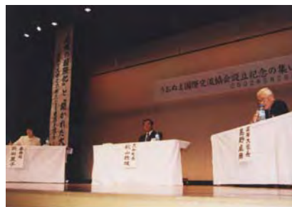
大和町長、国際大学学長による夢っくす対談 「地域の国際化と開かれた大学」