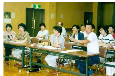
初級英会話教室(夜)で楽しく学習しています