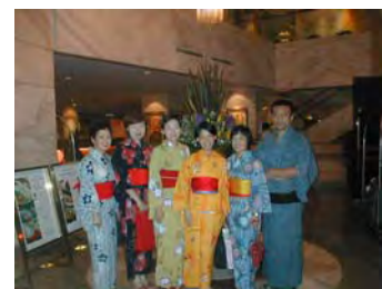
右端の粋な浴衣姿が私です