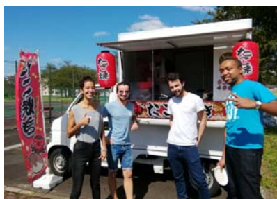
たこ焼きのお味はどうですか？