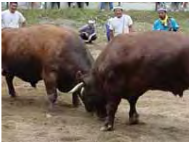
すごい迫力ですよ！ ほんと