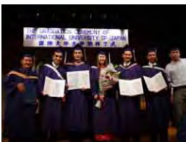
修了証(学位記)をもらってみんなうれしそう！