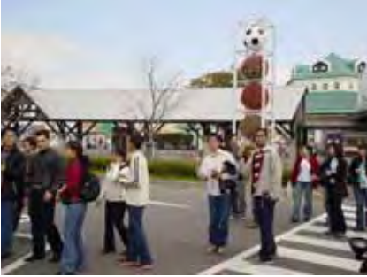
新潟ふるさと村の前から

10月17日(日)すばらしい秋空の下、学生37名、会員10名と大勢の参加により、バスツアーを行いました。