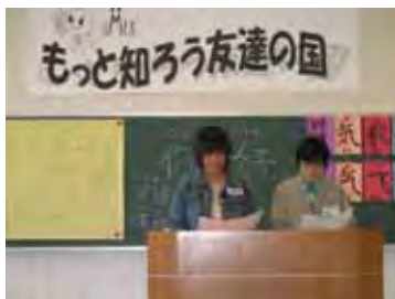
実かさんとももさん