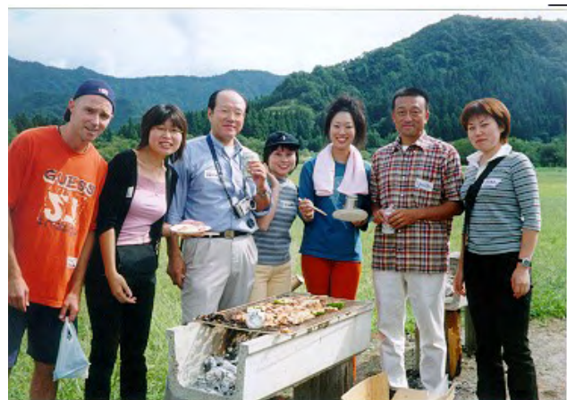
バーベキューで楽しく交流