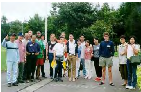
ミニドライブで大和町の名所をまわりました