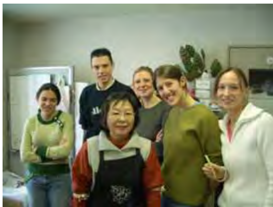
皆さん日本の寿司に大満足！