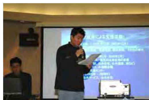
プロジェクターを使ったプレゼンテーション

し、第1期募金は春休みに被災地へ帰国する留学生に託し、現地で必要物資を購入し被災者に届けてもらう。その報告に基づき第2期支援活動を検討する。