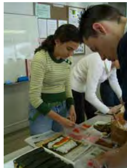
真剣な表情で取り組む学生たち

心配された大雪の中、サロンに入りきれないほど大勢の皆さんに参加して頂きました。キッズはラウンジでいなり寿司、学生はサロンでのり巻きと二つに分かれて作業をしました。のり巻きは大きいお母さん達が先生、留学生は海苔の上に寿司米、卵焼き、椎茸、かんぴょう、胡瓜、紅しょうがなどを色よく並べ、巻き簾を使ってとても器用に巻いていました。細巻きも作り、日本料理ならではの、たくさんの巻き寿司が綺麗に切り彩りよく並びました。いなり寿司の先生はヤンママ、ワンパク顔のどの顔も真剣に、油揚げに手際よく(?)ご飯を詰め、大小さまざまなおいなりさんをたくさん作りました。最後はみんなでサロンに集まり、おしゃべりに花を咲かせながらおいしくいただきました。久しぶりに夢っくすのイベントに参加し、楽しいひと時を過ごすことができました。(関 幸子)