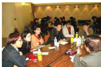
6つのテーブルに分かれて、学生・参加者との間で活発な意見交換が行われました。真剣に語り合う参加者の様子。