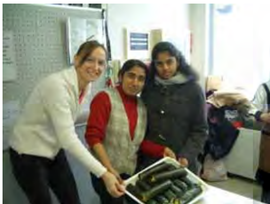
できあがった巻き寿司を前にハイ・チーズ