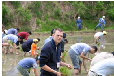
楽しかった？ディテルさん (感想寄せてくれた学生さん：中央)

6月5日に、外国の人たちと、がん入で田うえをしました。はじめに、田うえをして話せなかったけど、楽しくできてよかったです。つぎに、ぼくのうちで、きがえたりして、足もあらいました。そして、ごはんをたべて、話したりしました。「どこの人ですか。」ときいたら「スリランカです。」とこたえてくれました。さいごに、分校で、きねんしゃしんをとりました。田うえで、話せなかったけどノルウエーの人たちが話していたから、にぎやかになりました。はずしかったので、あまり話せなかったです。