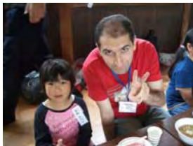
あずさちゃんとトルガハンさんとのツーショット！