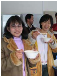
美味しそうですね！

の餅が付き上がる。早速、キナコ餅、雑煮、あんこ餅、大根おろして食べる。やはり、付きたての餅はコシがあり格別の味がする。食べ終わる頃には、2回目のもち米も吹き上がり、再度餅を付く。杵を持つ二人の呼吸も合い、1回目より上手にできた。満腹と思っていたのに、また、食べてしまう。最後に、留学生達と羽根突きをして、終了となった。