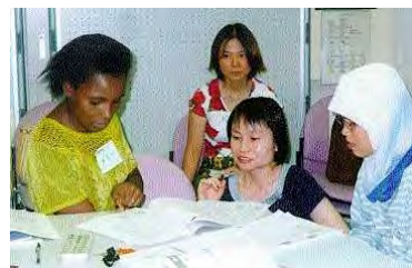
留学生との日本語会話を楽しまます