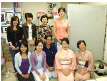
篠田さん(一番右)とお手伝い頂いた会員の方と学生さん