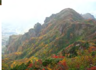
紅葉に染まった八海山