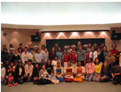
ダンスグループの方たちとの記念写真

とても良い踊りを観させていただき、今回のお話をもってきてくださったクーレイ先生とジェイ先生に感謝しています。もし機会があったら、また拝見したいと思います。できれば、スリランカで。