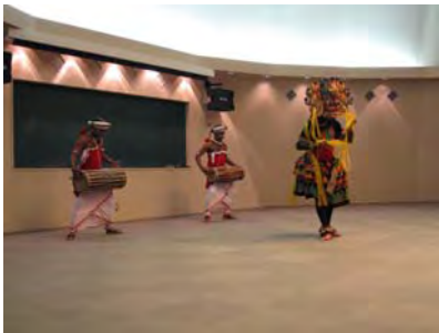
ダイナミックな演技に感動!

10月7日(土)のスリランカ舞踊公演を観に行きました。来場者はおよそ80名くらい。7名のダンスグループの方たちが民族衣装をまとい、男女のグループに分かれて交互に踊りを披露してくれました。