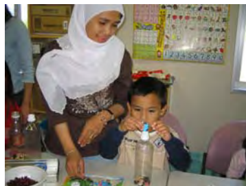
ペットボトルを使ったマラカス作り