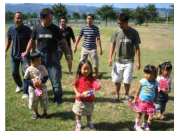
みんなでポチョポチョダンスを踊る