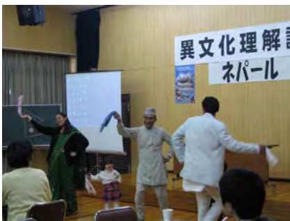
ネパールの踊りを披露する学生さん

おいしいネパールの料理を頂くこともでき、楽しい会を開いてくれた学生の皆さん、スタッフの方々に感謝します。どうもありがとうございました。ダニャバード！