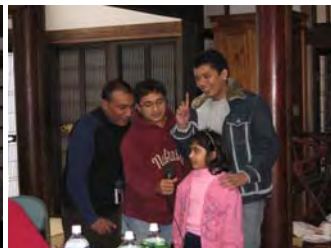
学生さんによる合唱

心を持ってくれるとは思いますが、イベントに参加してくれる学生さんは、日本に親しみと興味を持ち、自ら積極的に交流を求めているためか、表情や身振り、まなざしに暖かさを感じます。そんな学生さんたちには、より日本や地域のことを知ってもらい、より好きにたってもらいたいと思っています。