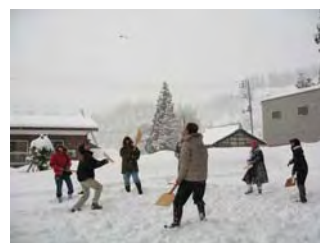
跳ねっ返しを楽しむ