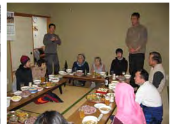
集落の皆さんとの新年会