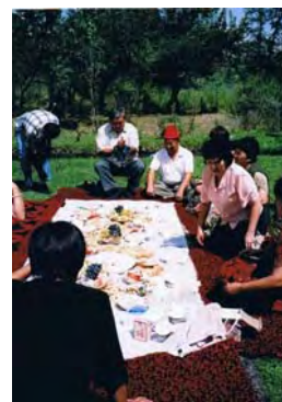
ナジックさんの親戚のお宅での伝統的なパーティー