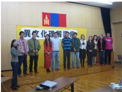
モンゴルからの学生さん勢揃い！