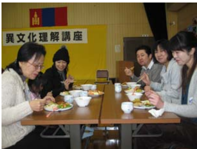
モンゴル料理による昼食