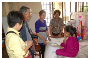
ゆきちゃんとの再会