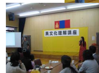
学生さんがモンゴルの歌を披露