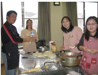
お料理を準備する学生さんたち

12月6日（日）に浦佐駅近くの働く婦人の家にて毎年恒例となった夢っくすの一大イベントである異文化理解講座を開催しました。