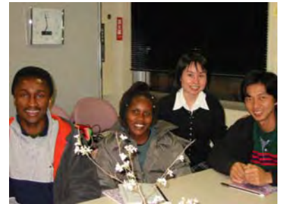
日本語クラス3月の様子