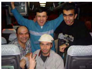
バスの中でも盛り上がりました。