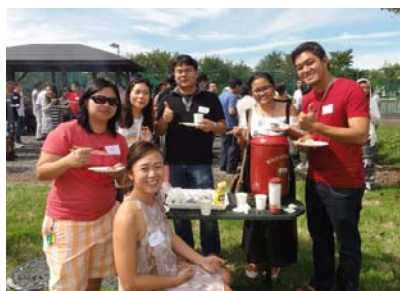
バーベキューのお味はどうですか？

9月25日（日）、国際大学バーベキューサイトにて毎年恒例の新入生歓迎パーティーが開催されました。