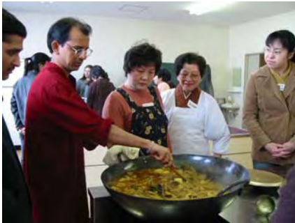
カレー大好きな私たち日本人。本場のカレーはさすがにスパイシー

1月10日、大和町「働く婦人の家」を会場にインド文化講座を開催しました。参加者は夢っくす会員のみならず、遠くは上越市や栃尾市からの参加者も交えて50名を超える大盛況でした。この講座の特徴は、留学生と夢っくす会員が共同プロジェクトとして、企画し実施している点です。こうした取り組みを通じて、「支援し」「支援される」関係を超えて留学生とのパートナーシップを築いていきたいと考えています。