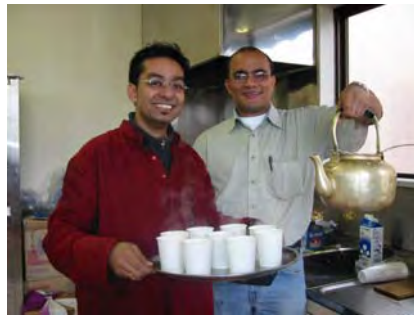
前日から70人前近くの食材の仕込みに大忙しだった留学生たち。

1月10日、大和町「働く婦人の家」を会場にインド文化講座を開催しました。参加者は夢っくす会員のみならず、遠くは上越市や栃尾市からの参加者も交えて50名を超える大盛況でした。この講座の特徴は、留学生と夢っくす会員が共同プロジェクトとして、企画し実施している点です。こうした取り組みを通じて、「支援し」「支援される」関係を超えて留学生とのパートナーシップを築いていきたいと考えています。