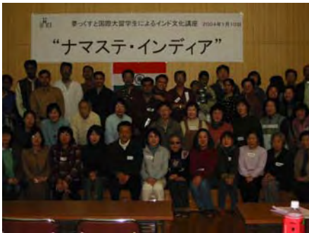
総勢50名を超える参加者

しかし、心残りが一つ。「サリーを着たい人は言ってください」とシャリーさんが言ったのに言わずに帰ってしまったことです。あ～あ、憧れのシルクのサリー、一度着たいんです。会を主催してくださった関係各位、インド留学生の皆様、どうも有難うございました。」