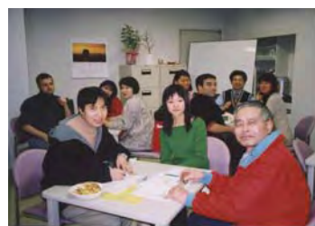
夢っくすサロンは留学生と会員の交流の場です。

9月3日(火)よりサロンを再開しています。 サロンでは留学生との「日本語会話」を楽しみます。 昼の部の11:00~12:30は留学生のための「初級日本語教室」を開講しています。 日本語の会話パートナーとして、ぜひご参加ください。