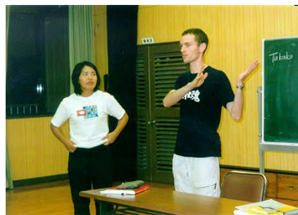
夢っくすでは英会話プログラムを充実していきます。