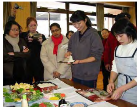
鬼のお面をつけた学生達 日本人にはおなじみの光景も彼らには新鮮！！