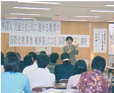
山西優二先生の国際理解教育講座が開催されます。写真は前回の講座の様子。