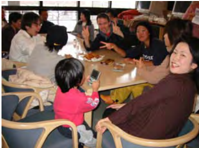
カフェで行われた運営委員会の様子 会員皆様の参加もお待ちしています