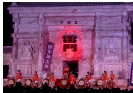
浅草雷門を再現した雪のステージショー も見学しました。