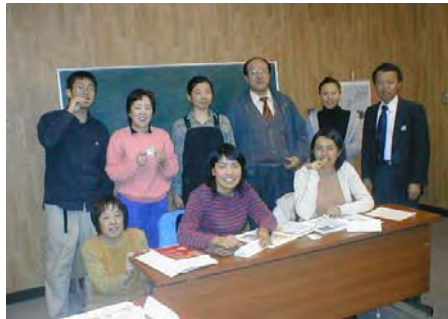
英会話教室水曜クラスの皆さん 楽しみながら学んでいます。

2月末にスタートしたチュータープログラムでは、現在17組の日本人と外国人のペアが日本語を通して国際交流を楽しんでいます。また、日本語を初めて勉強する外国人のための日本語クラスには、国際大学の学生とその家族だけではなく、外国人の教授も参加するなど、umexの日本語交流が徐々に広がりを見せています。