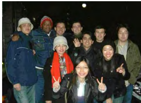
留学生の皆さんと一緒に。右から2人目が私です。

①一番行きたい国②興味のある言語③趣味や特技④夢っくすでやってみたいことは⑤今やっている国際交流⑥一言どうぞ!