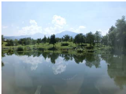
～美術館から眺める美しい景色～ 一度出掛けてみては如何でしょうか?

私は、夢っくすに入会してからの10年間しか国際大学の事を知りませんが、30年前この魚沼の地に突然多くの外国人の方が生活するようになり、そして今のように地域に根ざす間には色々な事があったのではと思います。今年はまた多くの新しい学生さんが入学すると聞いております。私達夢っくすのメンバーもこの志高き国際大学の学生さんが少しでもこの浦佐での生活を楽しんでいただくお手伝いできればと益々思いを強く致しました。