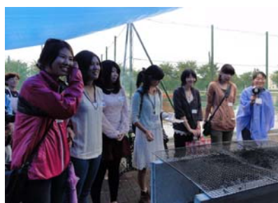
団体会員である北里大学保健衛生専門学院の英語クラブの学生さんたち

去る8月28日（火）、国際大学研究所のロビーに於いて、2012年Eビジネスの修了式が行われました。今年は既に帰国してしまっている学生もいたりして、7人だけの小さな修了式でした。人数が少なかったため、学生さんたちはとても仲