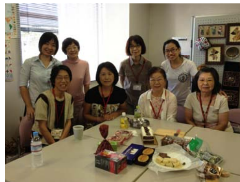
ミタンさん（後列右）との再会のために集まった夢っくす会員の皆さん

こんな風に卒業された学生さんたちと交流が続くのは素晴らしいですね。忘れられない思い出が沢山増えるといいなと思い、他の方たちの交流も知りたいなと思いました。