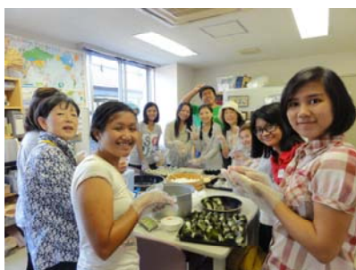
みんなでお握りを作っているところ