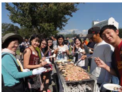
バーベキューは美味しいですか？

コシヒカリの稲穂が黄金色に輝き、魚沼が一年で一番美しい季節、屋外イベントに最高の日和に恵まれ、9月28日(日)に国際大学のバーベキューサイトでパーティーが開催されました。会場設営、おにぎり造り、食材仕込みの段階から多くの学生達が集まり、手伝ってくれました。準備は、学生と夢っくすボランティアの共同作業で進められました。“皆さん食べましょう！”